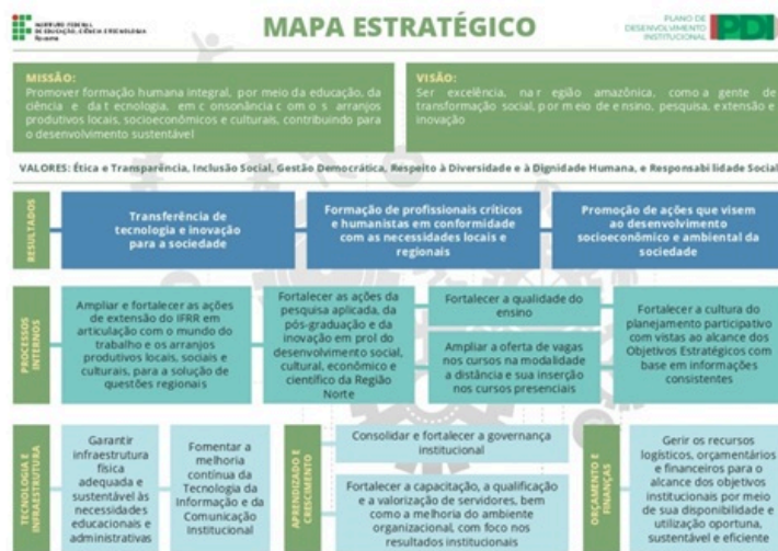
Figura 2 – Mapa Estratégico 2019-2023 do IFRR

Fonte: Plano de Desenvolvimento Institucional (PDI)